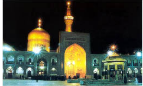
مرقد الإمام علي بن موسى الرضا عليه السلام

هي السيدة الجليلة نجمة عليها السلام والدة الإمام علي بن موسى الرضا عليه السلام من أسمائها ( تكتم ، طاهرة ، أروى سمكن التوبية وسمان ) كنيته أم البنين قد تزوجها الإمام موسى بن جعفر عليه السلام وروي عنه انه قال: (والله ما اشتريت هذه الأمة إلا بأمر الله ووحيه فقال: بينما أنا نائم إذ أتاني جدي وأبي عليهما السلام ومعهما قطعة حرير فتشرها فإذا هو قميص فيه سورة هذه الجارية فقال: يا موسى ليكونن في هذه الجارية خير أهل الأرض ثم أمرني إذا ولدته إن أسميه علياً وقال: إن الله تعالى يظهر به العدل والرأفة طوبى لمن صدقه وويل لمن عاداه وجحدته وعانته.