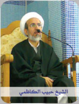
الشيخ حبيب الكاظمي

إن لمأساة الإمام الحسين عليه السلام وقعاً متميزاً سواء في حياة الأنبياء السلف، أو بالنسبة إلى خاتم الأنبياء و ذريته. و مقارنة إجمالية بين حالة الإمام عليه السلام في يوم عرفة ( بدعائه) المتميز و بين حالته في يوم عاشوراء ( بأبحاثه) الثقيلة تبين شيء من عظمة الكارثة و كيف إنه عز على رب العالمين أن يُعامل أعرف أهل زمانه بالله عز وجل هذه معاملة التي لم يشهد لها التاريخ مثلاً. و من هنا كان الارتباط به من خلال إحياء ذكره و التأثر بمصابه و من أعظم سبل نيل رضا الرب بما لا يخطر على العقول إذ إن عظمة المأساة مما لم تخطر على الأذهان..