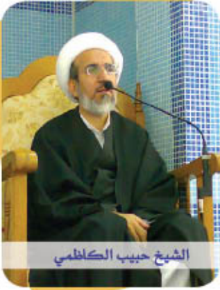
الشيخ حبيب الكاظمي

مع خلقه تحنناً وتكرماً .. وقد ورد في الحديث القدسي : { يا عبادي! لو أن أولكم وآخركم وإنسكم وجنكم كانوا على قلب اتقى رجل منكم، لم يُزد ذلك في ملكي شيئاً .. يا عبادي! لو أن أولكم وآخركم وإنسكم وجنكم اجتمعوا على صعيد واحد ، فسألوني وأعطيت كل إنسان منكم ما سأل ، لم يُنقص ذلك من ملكي شيئاً ، إلا كما ينقص البحر أن يغمس فيه المحيط غمسة واحدة } .