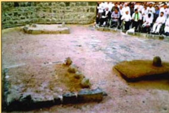
مدينة محمد أكبر

٣- منه انتشر اولاد رسول الله صلى الله عليه وآله لهذا يُقال له آدم بني الحسين عليه السلام وهو اول من اختار الاعتكاف والاعتزال، وأول من سجد على خاتم وسبحة من تربة الامام الحسين عليه السلام وهو أكثر الخلائق بكاءً فقد ورد ان رؤوس البكائين أربعة آدم ويعقوب ويوسف والامام زين العابدين عليه السلام .