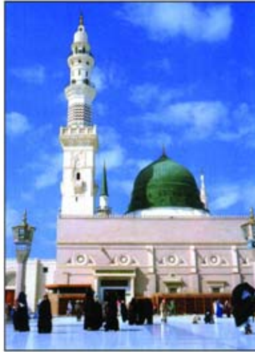
وعليها شمعات هوقع الى الارض مغشياً

عليه فتعجب منه قريش فضحكوا فقال: اتضحكون هنا نبي السيف وليبينكم اي يهلككم وقد ذهب النبوة عن بني اسرائيل الى الابد فتفرقوا يتحدثون بما قال (١) ، ولد خاتم الانبياء وسيد المرسلين محمد بن عبد الله بن عبد المطلب وامه آمنة بنت وهب في السابع عشر من ربيع الاول من عام الفيل بعد ان فقد اياه ثم استرضع في بني سعد وردّ الى امه في الرابعة او الخامسة من عمره ثم توفيت امه في السادسة من عمره فكفله جده واحتضنه وبقي معه سنتين ثم ودع الحياة بعد ان اودعه الى عمه الحنون (ابو طالب) حيث بقي مع عمه الى حيث زواجه وسافر الى الشام وهو في الثالث عشر من عمره، وحضر النبي حلف الفضول وهو في العشرين من عمره في الخامسة والعشرين بعدها بعث وهو في الاربعين من عمره.