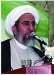
الشيخ: حبيب الكاظمي