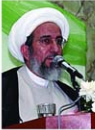
الشيخ: حبيب الكاظمي

يمكن الاجتماع معه تحت سقف واحد ، أو هل يمكن دائما ان نقطع صلواتنا بأشخاص كأم الأولاد والأرحام؟ إن من قواعد التعامل في أجواء الانفعال: إن تلقن الطرف المقابل أنك لا تتكلم معه من منطلق اللجاجة والخصومة والانتصار للذات ، بل من منطلق الوصول إلى الحق ، فإن اعتقاد الطرفين أنهما يبحثان عن الحق يخفف كثيرا من اجواء الفتنة والتضارب في الآراء .. و القرآن الكريم ذكرها حقيقة واضحة : { أفمن يهدي إلى الحق أحق أن يتبع } .. و يا ليت الذين يتخاصمون في أمور الحياة ، يحتكمون إلى العقل والشريعة ، وهل هناك حكم خير منهما ١٩..