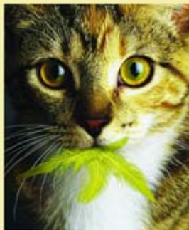
لوبية هادي الفتلاوي